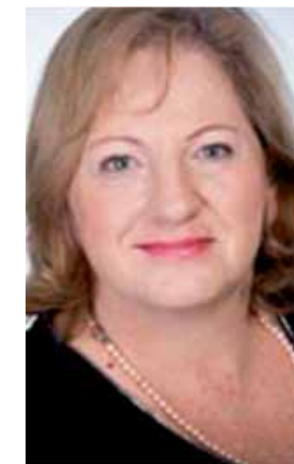
ANDREA ZLATAR VIOLIĆ ministrica kulture