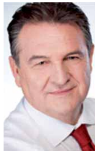
RADIMIR ČAČIĆ prvi potpredsjednik Vlade i ministar gospodarstva

Istodobno, Vlada će, kako je rekao, predložiti izmjene energetske zakona te zakona o proračunu i lokalnoj upravi koje će omogućiti širi zamah u obnovi javnih zgrada - škola, vrtića, bolnica, ministarstava i drugih.