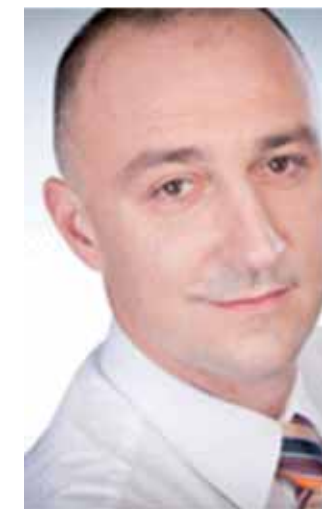
IVAN VRDOLJAK ministar graditeljstva i prostornog uređenja