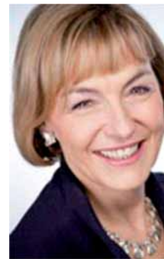
VESNA PUSIĆ ministrica vanjskih i europskih poslova